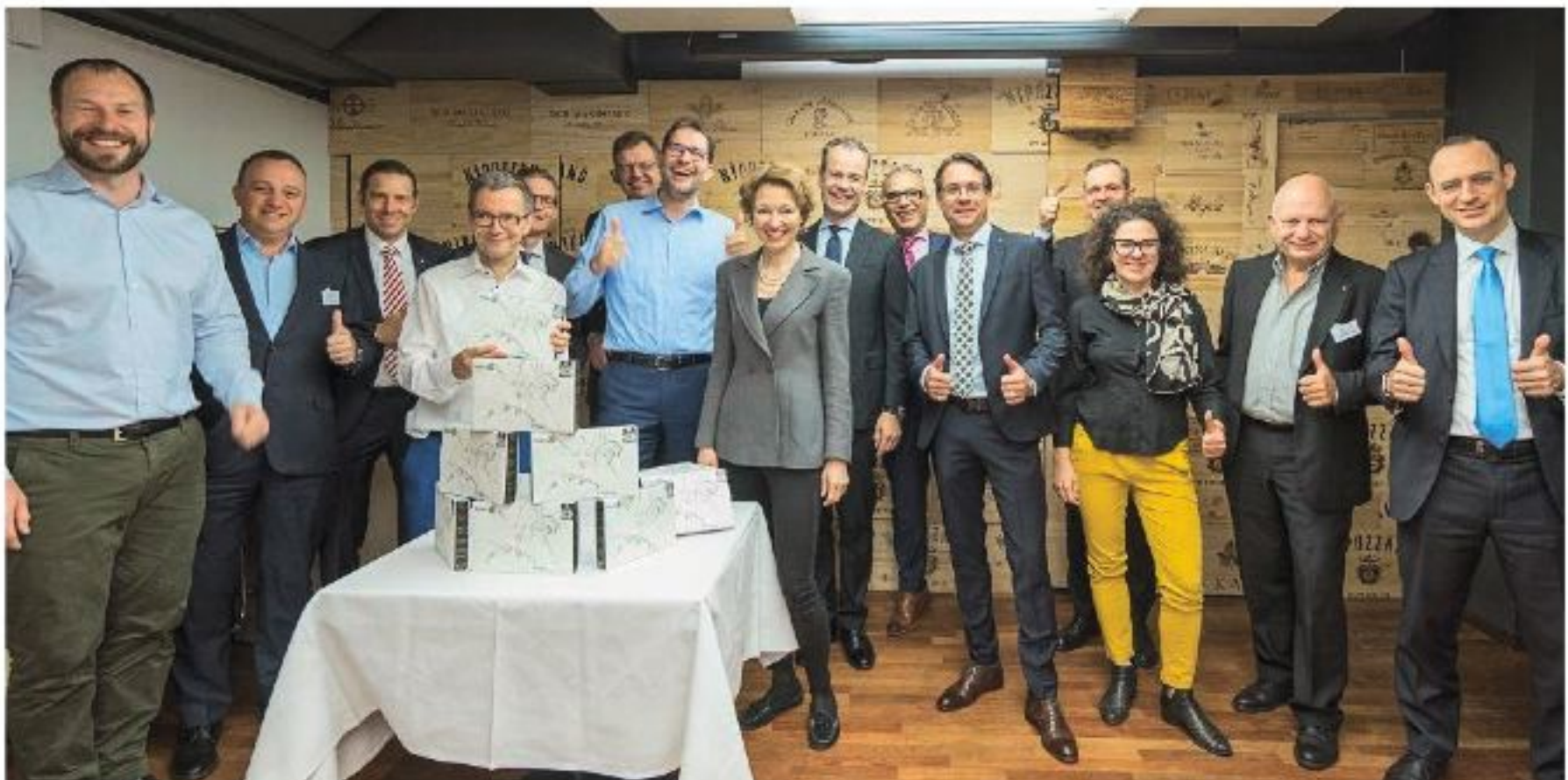
Legen sich für die Ausrottung der Kinderlähmung ins Zeug: Mitglieder des RC Zürich City am Weltpoliotag