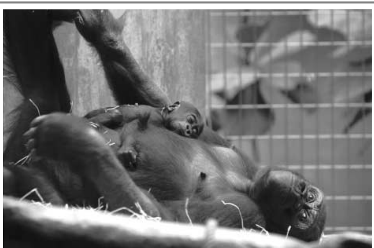
Das Leben entdecken. Das Gorillamädchen Chelewa, das am 31. Dezember 2005 im Basler Zolli auf die Welt kam, verbringt noch immer jeden Tag am Körper seiner Mutter Wima (sieben Jahre alt). Die Kleine hält sich mit Händchen und Füsschen an den Haaren der Mama fest. Chelewa macht ansonsten grosse Entwicklungsschritte – seit ein paar Wochen kann sie mit ihren Augen Gegenständen und anderen Mitgliedern der Gorillagruppe folgen.

Die Sozialpolitik braucht laut Opielka starke – auch religiöse – Gründe. Trotz dieser deutschen Stärke, die in der Suche nach einem soliden Fundament liegt, meint er aber salopp: «Am Schweizer Wesen soll das Deutsche genesen.»